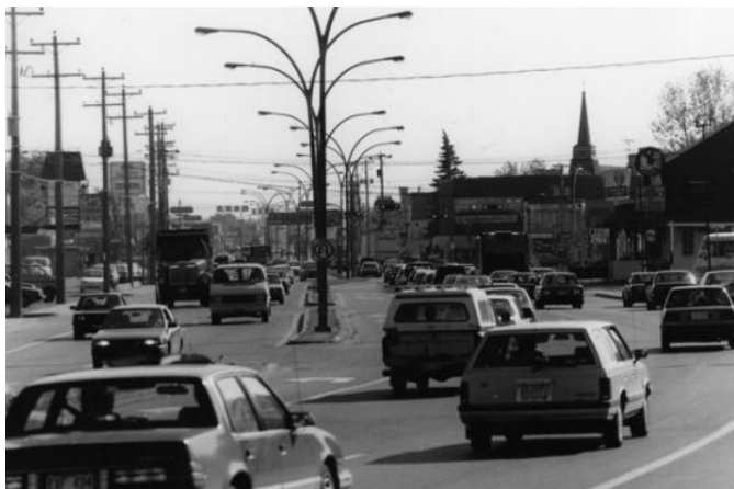
Le boulevard Harwood en 1991.