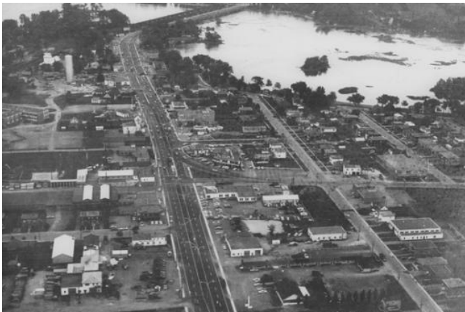
Vue aérienne du boulevard Harwood en direction de l'île Perrot en 1966.