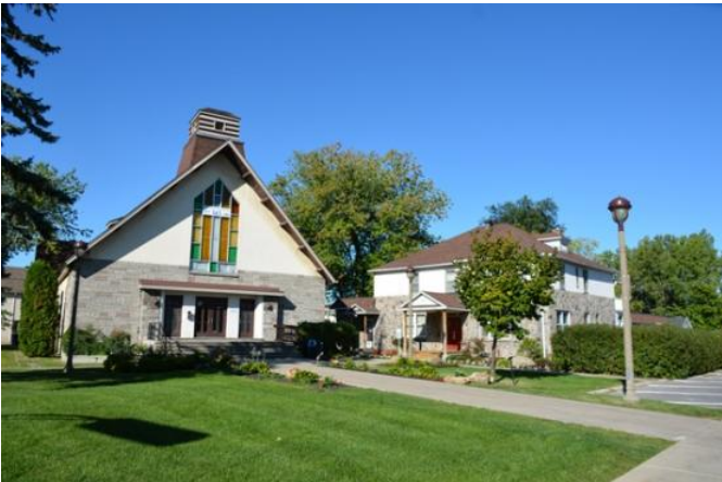
Ancienne église Saint-Jean-Baptiste et son presbytère (145, boulevard Harwood).