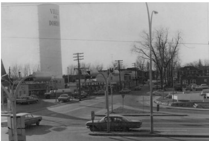
Le boulevard Harwood coin Saint-Charles en 1966 (avant la construction des viaducs). © Centre d'archives de Vaudreuil-Soulanges, Fonds Centenaire de Dorion, M01b18,9.