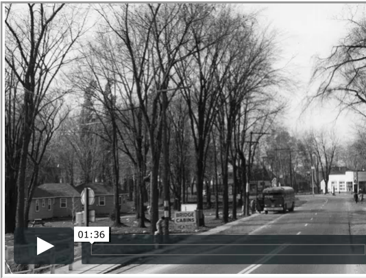
Le boulevard Harwood - origine et développement.