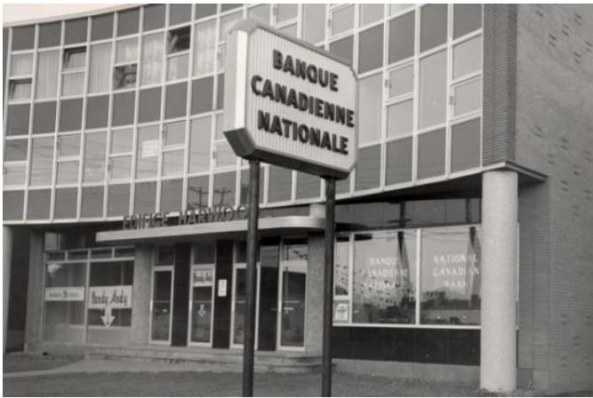
Ancienne succursale de la Banque Nationale du Canada à Dorion en 1959 (182, boulevard Harwood).