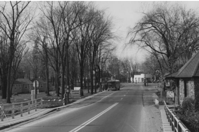
Le boulevard Harwood vers 1955, vue à partir du pont Taschereau.