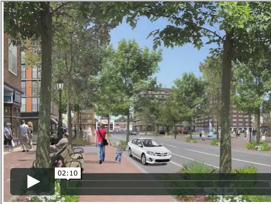
Le boulevard Harwood - une avenue commerciale et une vision d'avenir.