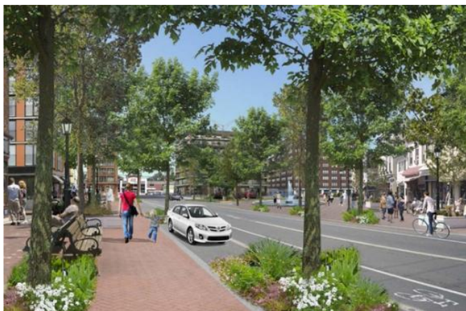
Réaménagement proposé du chemin de Lotbinière débouchant sur le boulevard Harwood. © Ville de Vaudreuil-Dorion, 2015.