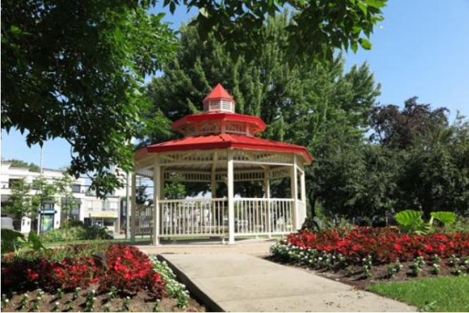
Kiosque du parc du Carré-Dorion.