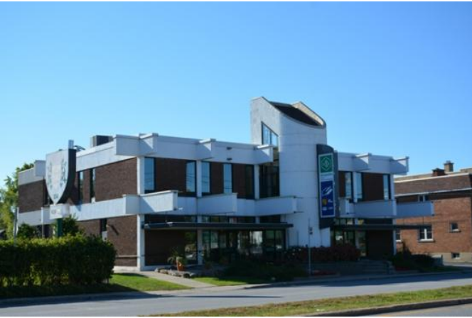
Caisse Desjardins de Vaudreuil-Soulanges. Les plans de l'édifice de 1964 sont de l'architecte André Marchand (170, boulevard Harwood).