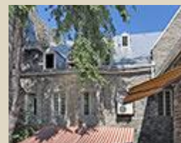
L'arrière du bâtiment.