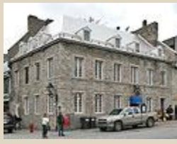
Le bâtiment vu de l'intersection de la place Jacques-Cartier et de la rue Saint-Paul Est.