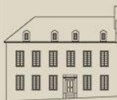
Élévation principale. ©Ville de Montréal, vers 1995. Cliquez sur le dessin pour une version agrandie.