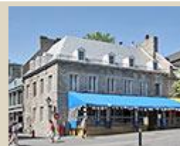
photographie Denis Tremblay, 2007