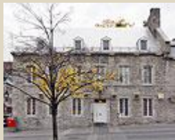
La façade principale, place Jacques-Cartier.

Cliquez sur l'image, pour une version agrandie.