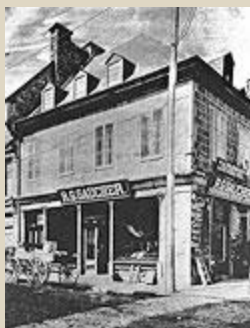
Façade de la rue Saint-Paul à la fin du XIXe siècle. Dominion Illustrated , 1891, p. 43.