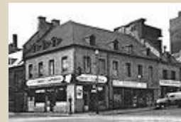
Le bâtiment photographié en 1953. ©Ville de Montréal, Archives, Z-500-16, cote CA M001 VM094-Y-1-17-D0496-P16.

Les termes précédés d'un * sont définis au glossaire .