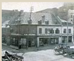
La maison-magasin en 1904.

Voir aussi les informations sur le ou les ensembles dont ce bâtiment fait partie.