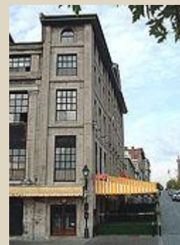
Rue de la Commune Est photographie ©Ville de Montréal, 2001

Les termes précédés d'un * sont définis au glossaire .