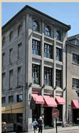
Rue Saint-Paul.

Cliquez sur l'image, pour une version agrandie.