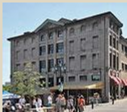
Place Jacques-Cartier.

À partir des années 1960, tout change. Des travaux de rénovation ont lieu en 1968, en 1973 et 1977. Le restaurant Chez Queux s'y installe alors. Il partagera les lieux avec d'autres restaurants, des ateliers et une discothèque. En 2004, il est toujours dans l'immeuble (relié au bâtiment voisin). Il y a alors des logements aux derniers étages.