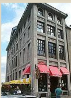
Rue Saint-Paul Est photographie Denis Tremblay, 1998

©Bibliothèque et Archives nationales du Québec, Albums de rues Édouard-Zotique Massicotte, 2-179-a