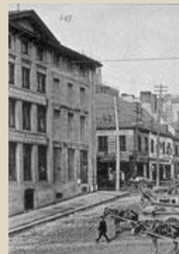
Vue de la façade de la place Jacques-Cartier dans le premier quart du XXe siècle. On y voit l'enseigne de l'occupant de l'époque, Mander Frères... Vernis, couleurs, encres d'imprimerie.