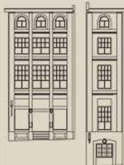
Élévations rues Saint-Paul et de la Commune. ©Ville de Montréal, vers 1995. Cliquez sur le dessin pour une version agrandie.