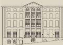
Élévation place Jacques-Cartier. ©Ville de Montréal, vers 1995. Cliquez sur le dessin pour une version agrandie.