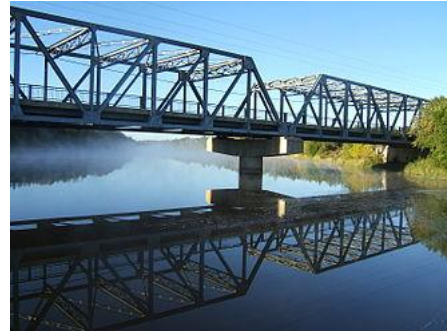
Pont du chemin du Lac sur la rivière du Loup, à Saint-Antonin. Le chemin du Lac reprend le tracé d'origine du chemin du Portage de 1783.