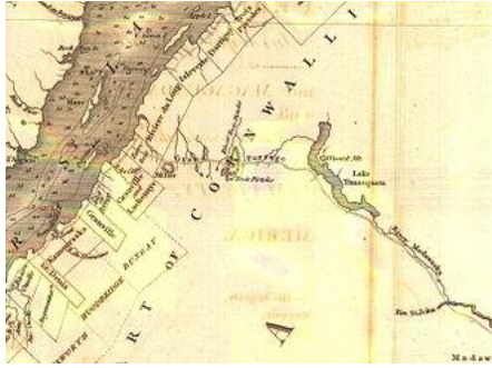
Le chemin du Portage en 1813, tel qu'il apparaît sur une carte de l'arpenteur Samuel Holland