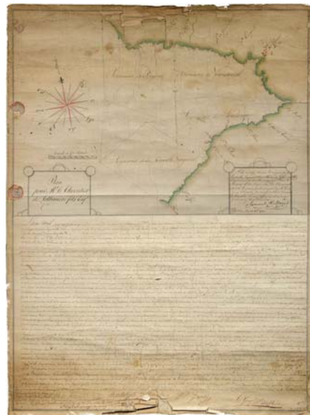
Carte de la région de Vaudreuil-Soulanges, 1791

La seigneurie de Vaudreuil était une seigneurie en Nouvelle-France. Elle était située dans l'actuelle municipalité régionale de comté de Vaudreuil-Soulanges en Montréal ( Suroît ).