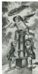
Robert Sproule et Adolphus Bourne, Allégorie des arts (littérature, architecture, peinture, dessin et musique) , 1832