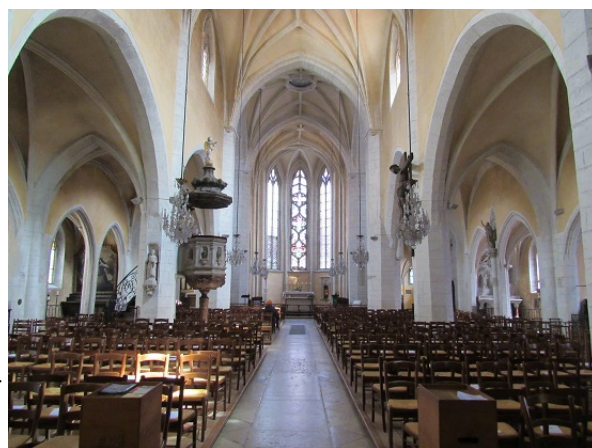
intérieur de la basilique