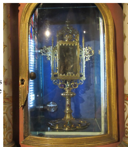
Reliquaire de Notre-Dame de Gray