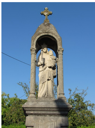
Monument du voeu de 1914

Tout le XIXème siècle voit de nouvelles manifestations de dévotion envers Notre-Dame de Gray : voeu de Mgr Mathieu pendant l'épidémie de choléra de 1849; voeu des dames de Gray lors de la guerre de 1870, qui se manifeste par l'offrande d'un vitrail.