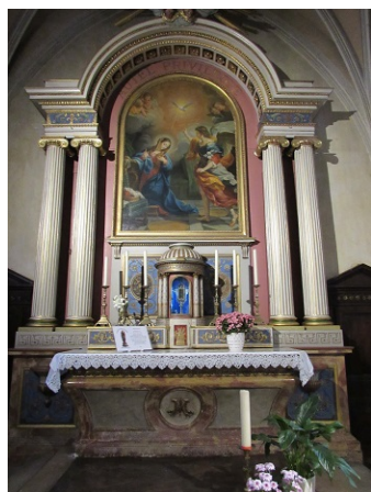
Chapelle de la Vierge

retrouve parmi les objets confisqués au couvent, dans le grenier de l'hôtel de ville. Elle passe le reste des jours sombres dans la maison Rousset, vénérée par la famille et quelques amis fidèles, jusqu'à ce qu'elle soit remise à la paroisse à la restauration du culte. Placée dès 1802 dans l'église paroissiale, on lui affecte la chapelle à gauche du chœur où elle est solennellement installée le 9 août 1807.