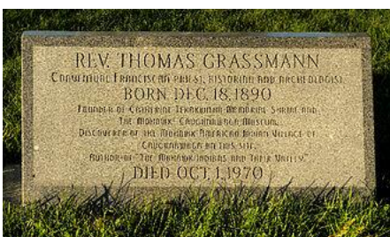
La pierre tombale de Grassmann sur le site de Caughnawaga.