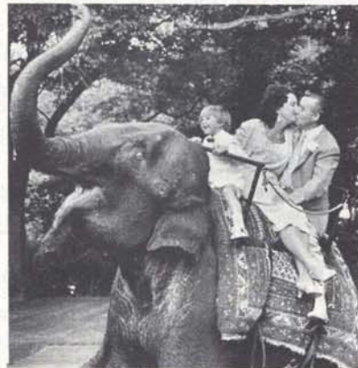
Le 22 août dernier, avec leurs six enfants et plus de cent invités,