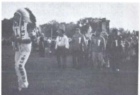
Le Pow-wow, grande cérémonie amérindienne