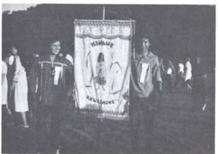
La bannière des Agniers de Saint-Régis