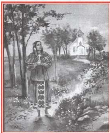
Peinture réalisée par Shirley Shopteese Monoz de Phoenix, Arizona. Kateri revêt la robe traditionnelle des Potawatomi.