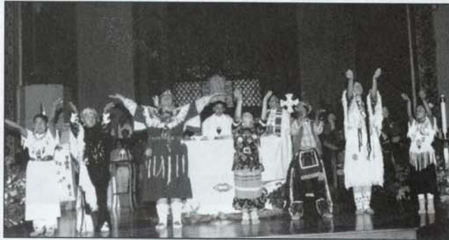
À l'église St-Joseph, chant du Notre-Père.

sent qu'il y a un bel effort pour retourner à ses racines même si les modes de vie actuels des Indiens