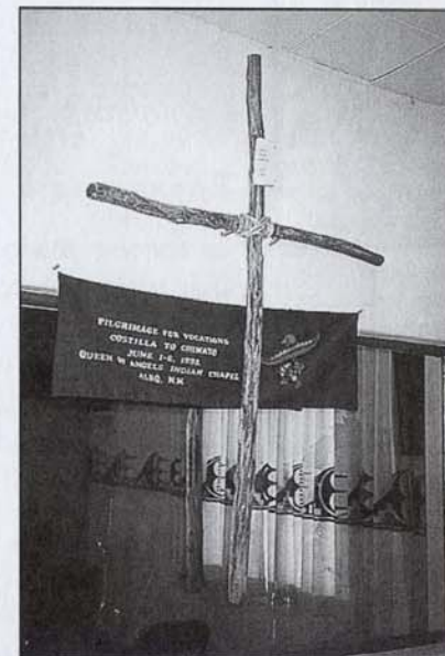
La croix du pèlerinage en faveur des vocations.