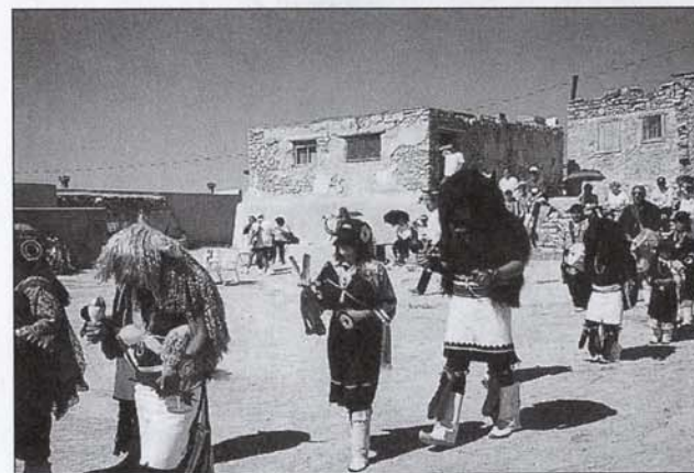
Danseurs colorés à la mission San José de Laguna.