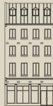
Élévation, rue de la Commune Est. vers 1995 Cliquez sur le dessin pour une version agrandie.