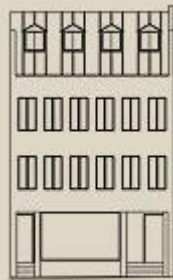
Élévation, rue Saint-Paul Est. ©Ville de Montréal, vers 1995 Cliquez sur le dessin pour une version agrandie.