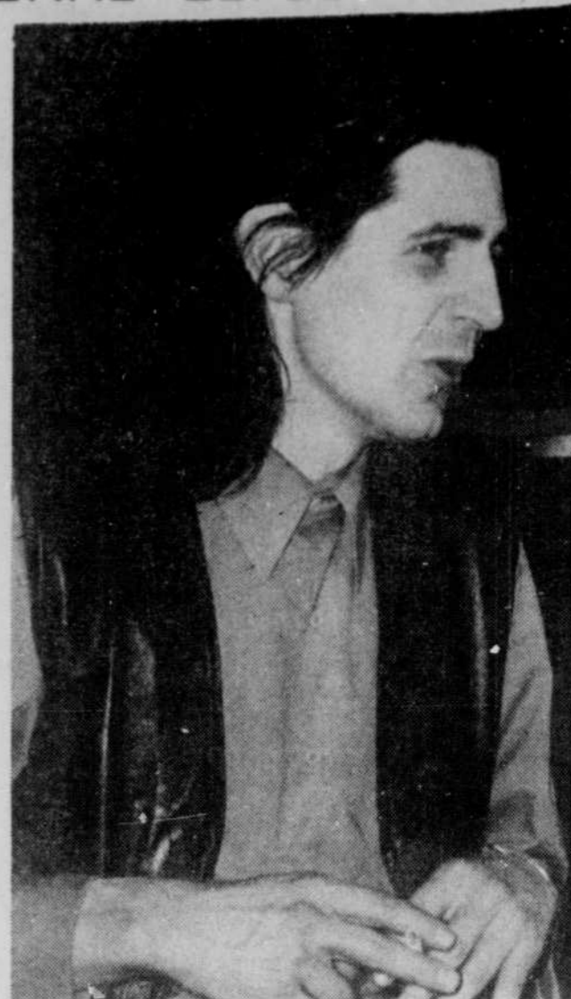
Le cinéaste québécois Jean-Pierre Lefebvre.

"J'aimerais annoncer en même temps, ici, que le film "Les maudits sauvages" reprend l'affiche dès vendredi le 25 février 1972, avec le deuxième suivant: "Il ne faut pas mourir pour ça", au cinéma Les Rivières. Programme "pour tous". Nous espérons que ceci prouvera notre bonne volonté et corrigera l'erreur possible, s'il y a lieu".