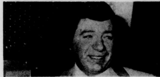
Claude Blanchard: Prix Citron

Pour la huitième année, on a décerné, lundi soir, à Montréal, les prix Orange et Citron aux artistes les plus gentils et les plus désagréables de la "colonie" artistique montréalaise. Les journalistes montréalais ont de plus, "couronné" l'émission radiophonique "Bonjour Montréal" animée à CBF tous les matins — quand il n'y a ni grève ni lock-out — par Michel Desrochers, et la série télévisée "Bon dimanche", de Télé-métropole, les Mandarines. Gilles Vigneault et Dominique Michel ont ainsi été couronnés les plus gentils et Claude Blanchard et Michelle Richard, les moins gentils, pour la deuxième fois, dans leur cas. Les journalistes montréalais ont de plus, "couronné" l'émission radiophonique "Bonjour Montréal" animée à CBF tous les matins — quand il n'y a ni grève ni lock-out — par Michel Desrochers, et la série télévisée "Bon dimanche", de Télé-métropole, les Mandarines. On a également souligné,